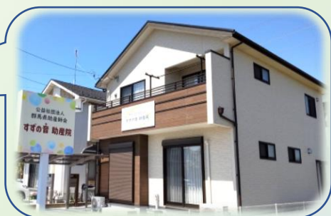
群馬県助産師会立すずの音助産院 (令和3年2月11日開院しました)